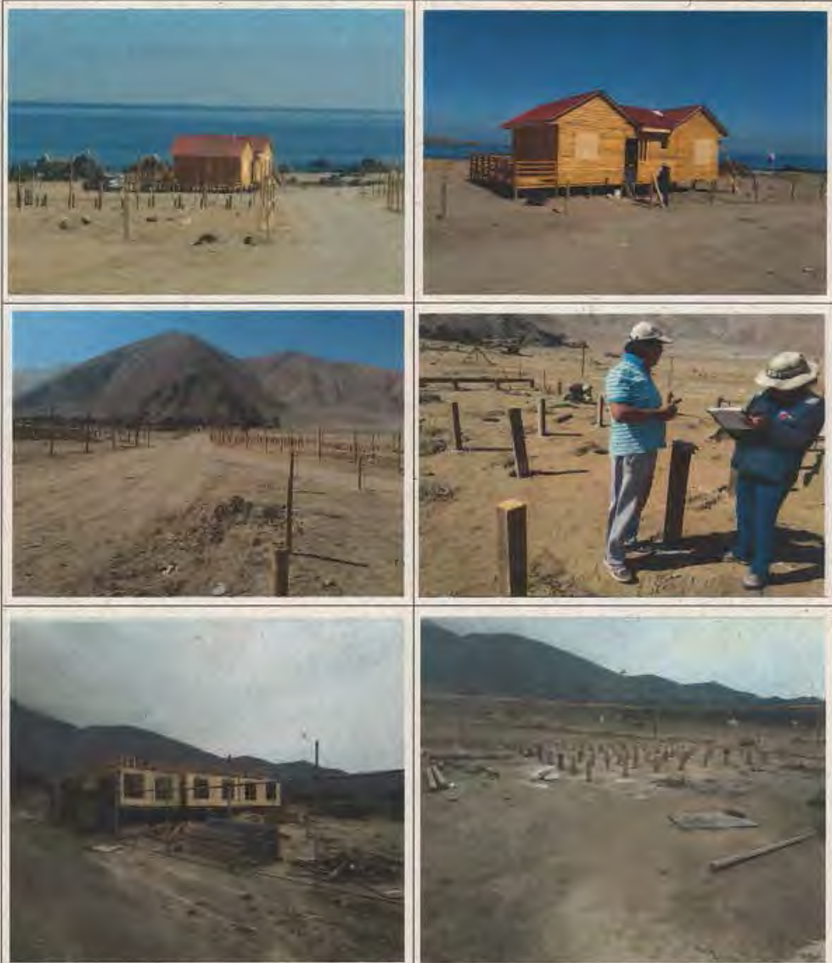
Fotografía N° 1, 2, 3 y 4 de 30 de mayo de 2019, en compañía de fiscalizadora de Bienes Nacionales de Antofagasta, ubicación Caleta los Chinos, cercano a Caleta Urco.

Registros fotográficos validación en terreno sector Caleta Urco y Caleta Buena, Tocopilla