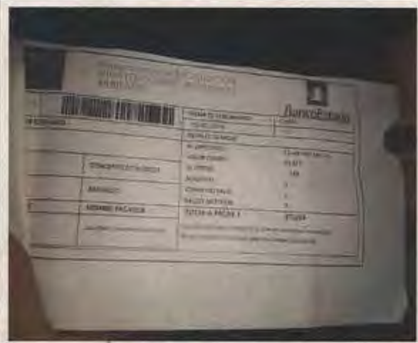
Fotografía N° 1, 2, 3 y 4, de 27 de mayo de 2019, en compañía de fiscalizadora de Bienes Nacionales de Antofagasta.