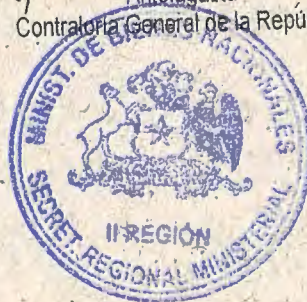
HÉCTOR RAMOS CUEVAS Contralor Regional Subrogante Antofagasta Contraloría General de la República