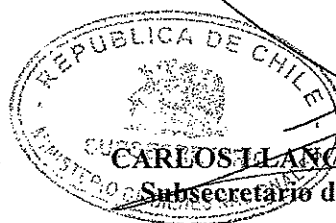
CARLOS LLANCAQUEO MELLADO Subsecretario de Bienes Nacionales